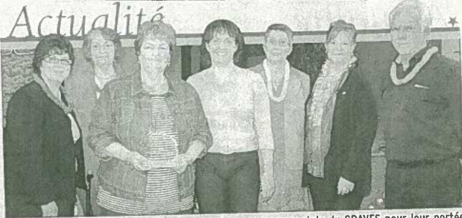
L'association L'amitié n'a pas d'âge a rendu hommage aux projets du GRAVES pour leur portée communautaire.