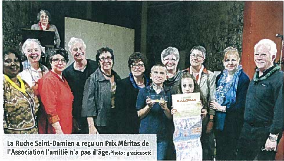
La Ruche Saint-Damien a reçu un Prix Méritas de l'Association l'amitié n'a pas d'âge.

De son côté, la fête de Noël a permis de rassembler organismes locaux, membres du conseil municipal, élèves et professeurs des écoles de Saint-Damien, grands-parents, parents et enfants.