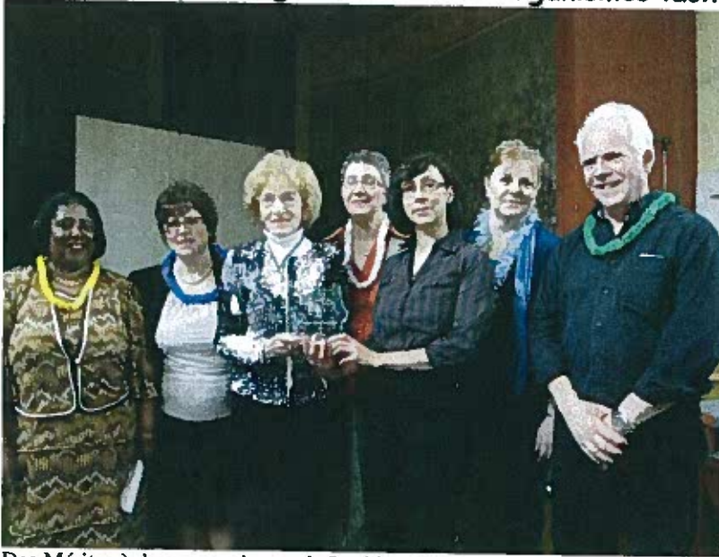
Des Méritas à deux organismes de Lachine

Des Méritas à deux organismes de Lachine Publié le 8 Juin 2011 Robert Leduc RSS Feed